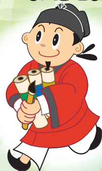
藤井寺市の公式キャラクター「まなりくん」