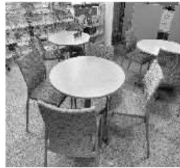
交流ひろば おしゃべりや、ミーティングなど ご利用にどうぞ。