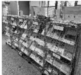
情報コーナー 市政情報、市民活動団体関連の チラシを設置しています。