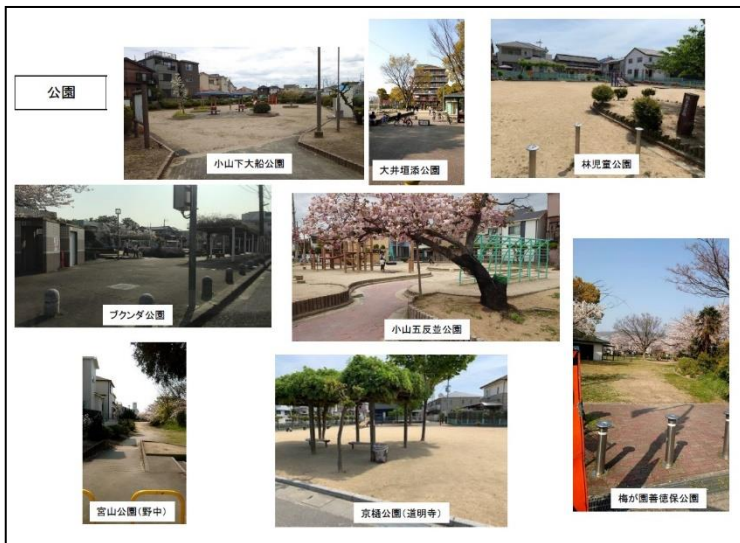
公園等の現状 写真