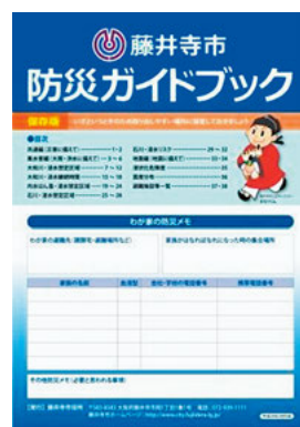
防災ガイドブック

消防団活動、各地区の自主防災組織の連携など自助・共助・公助の取組の強化を推進します。