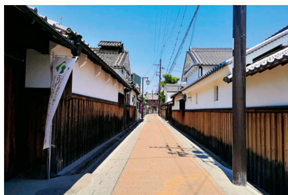
景観舗装と歴史的なまちなみ