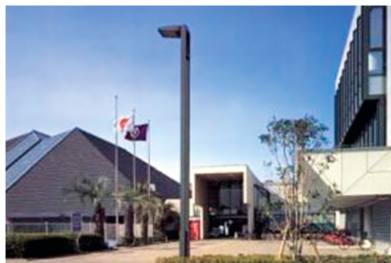
市立市民総合体育館

施設の将来需要や老朽度の判定、改修時に必要な費用等を総合的に勘案した上で、施設の更新、統廃合、長寿命化を図り、財政負担を軽減、平準化するとともに、市民が求める公共施設等の最適な配置、老朽化対策の実現をめざします。