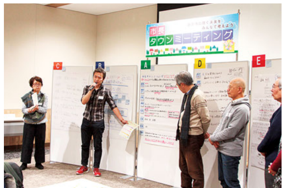
タウンミーティング

協働のまちづくりを推進していく上で、市民、行政それぞれが「協働」や「市民公益活動」について理解を深め、自分たちのまちは自分たちがつくるという機運の醸成を図ります。