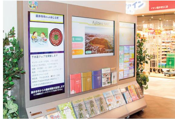
市政インフォメーションコーナー

ホームページやフェイスブック等の様々な媒体やICTを活用して、分かりやすく積極的に市政情報を発信するとともに、求めている市政情報へ市民が効率的にアプローチできる手法を検討します。また、市内外の関心を惹き付ける広報活動に取り組みます。