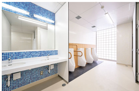
市立藤井寺中学校トイレ

児童生徒一人ひとりのニーズに応じたきめ細かな支援の充実を図るため、スクールカウンセラー※やスクールソーシャルワーカー※等を活用し、教育相談体制のさらなる充実を図ります。