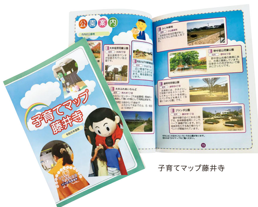
子育てマップ藤井寺

妊産婦及び母子の健康の保持増進のため、妊婦健康診査助成の増額や子ども医療費の助成による支援を図ります。また、産婦への産婦健康診査事業や産後ケア事業、妊産婦等への相談事業の継続、充実を図ります。