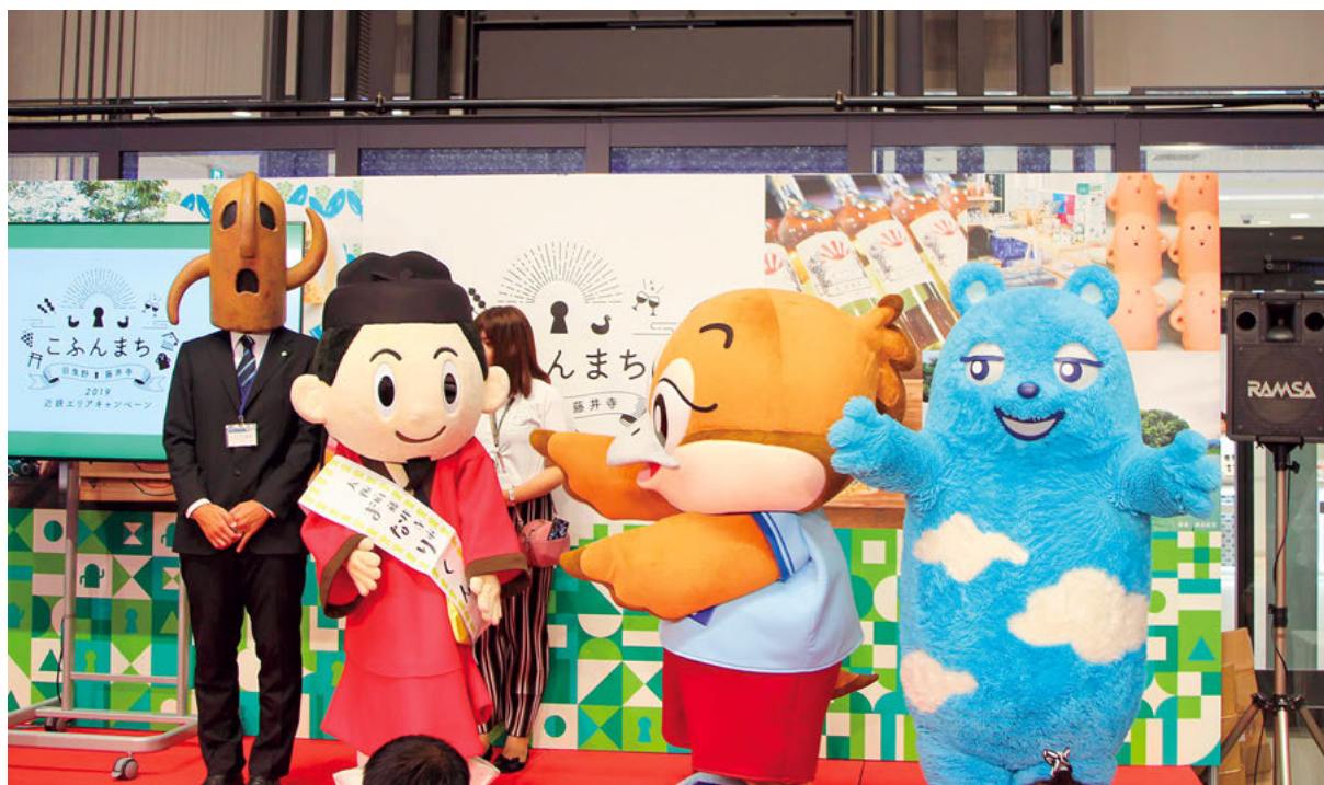
「こぶん列車」出発式

原動機付自転車を媒体にして本市の魅力を全国に発信することができるご当地ナンバープレート導入の取組を推進します。