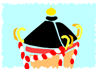
良所、好きな所、勢い、活力

市民と職員、民間が一体となって「よいしょ」と御輿をかつぐように盛り上げていきましょう