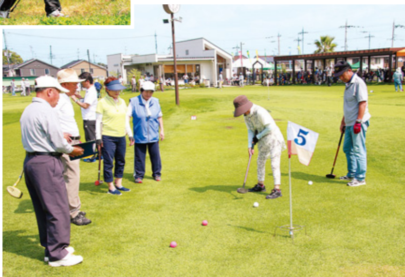
ふれあい交流グラウンド・ゴルフ大会