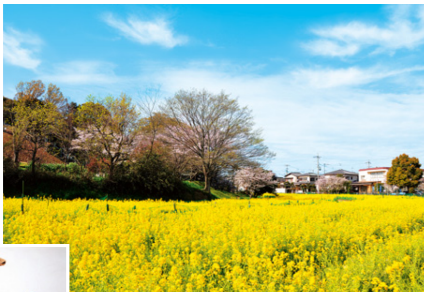
津堂城山古墳（菜の花）