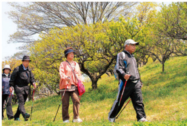
ノルディックウォーキング