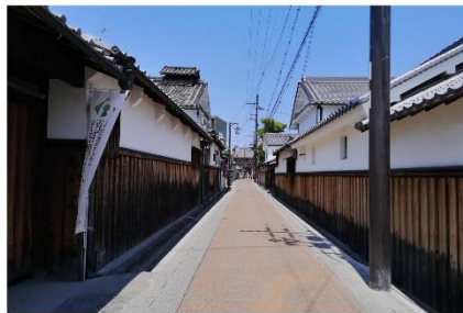
歴史的なまちなみ