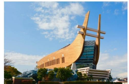
アイセルシェラホール

藤井寺市ホームページはこちら → https://www.city.fujiidera.lg.jp/