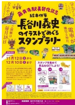
イベントチラシ デザイン

近鉄と藤井寺市は本スタンプラリーを通じて、藤井寺市の魅力を発信し、観光需要の創出に繋がりたいと考えています。