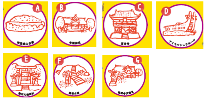
スタンプ デザイン

※本イベントは、「地域一体となった観光地の再生・観光サービスの高付加価値事業」の補助金の交付を受け、実施するものです。