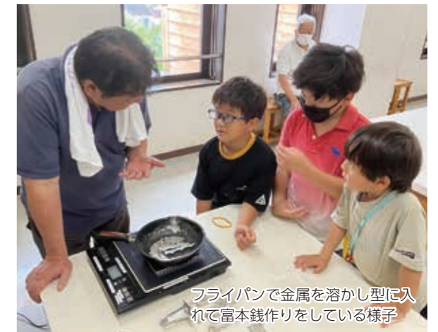
フライパンで金属を溶かし型に入れて富本銭作りをしている様子

夏休みの期間中に世界遺産「百舌鳥・古市古墳群」にちなんだ体験学習(富本銭作り、勾玉作り、銅鏡作り)を開催し、たくさん子どもたちが参加しました。