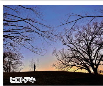
▲古室山古墳の薄暮が美しすぎる!