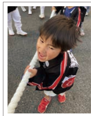
▲迫力あるこりゃせー/いっちゃん