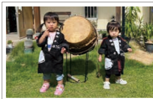
▲孫達が祭りに帰ってきました(へへ)/ノブノブ