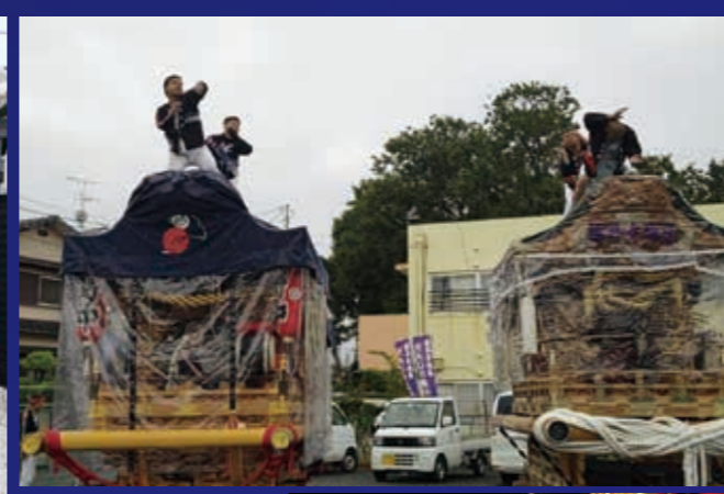
写真は16・17・27ページにも掲載しています。