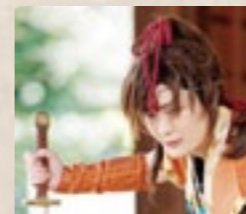
親衛隊長(立部円) 大王と姫を守る親衛隊長