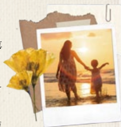
ペンネーム・写真のコメントを掲載