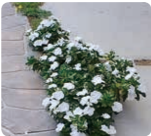
▲南向きのカーポート下、戸外で越冬している株