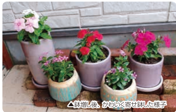
△鉢増し後、かわいく寄せ鉢した様子

ピンク・赤・白などカラーバリエーションが豊富で小ぶりのかわいい花を咲かせるニチニチソウ。初夏から晩秋まで毎日、次々に開花していくので、「日々草」といいます。