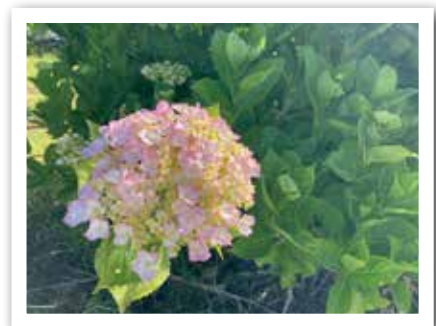
▲通勤途中の光景/ひまわり♪