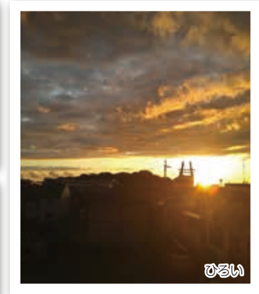
▼シラホールと夕方の空