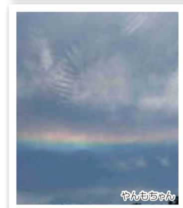
▲珍しい虹「環水平アーク」