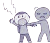
つれて行かれそうになったら 大声で助けを求め、 「子ども110番の家」に!