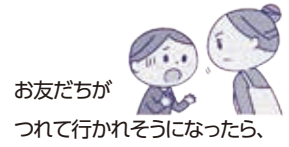
お友だちがつれて行かれそうになったら、すぐに大人に知らせます