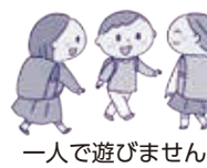
一人で遊びません