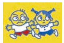
「子ども110番の家」目印のステッカー▲