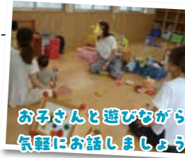
お子さんと遊びながら気軽にお話ししましょう

相談者の声 「相談にのってもらうことで、子どもの行動の一つ一つが『成長過程として必要なんだな』と受け止めることができました」