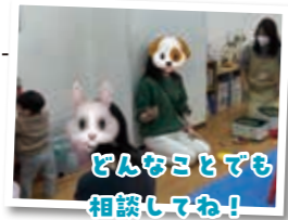
どんなことでも相談してね！

相談者の声 「第二子の出産に対する不安や、今後、通園する幼稚園や保育園の様子について先輩ママさんたちも含め、情報交換できました」