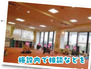
施設内で相談などもお伺いしています♪

相談者の声 「子育てに関する些細な疑問や悩みにも、気軽に相談にのってもらっています」