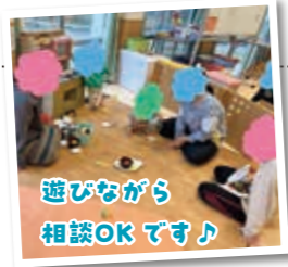
遊びながら相談OKです♪

相談者の声 「発語がゆっくりで心配だったので相談しました。助言いただき安心しました。」