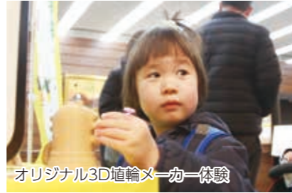
オリジナル3D埴輪メーカー体験