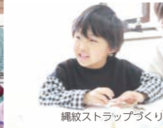
縄紋ストラップづくり