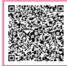
▲イベントカレンダー

市ホームページに各施設の イベントが一目でわかる 便利なイベントカレンダーを 載せてるぞ！見てな！