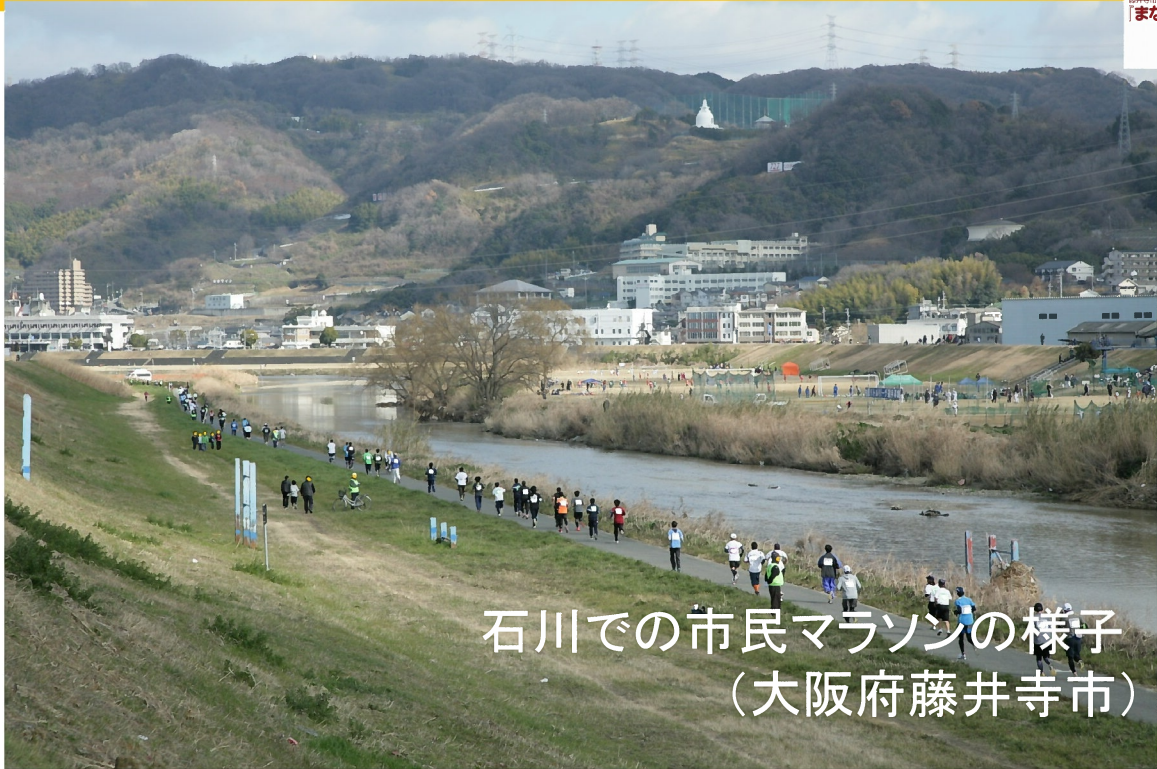
石川での市民マラソンの様子 (大阪府藤井寺市)