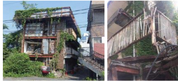
適正な維持管理が行われなくなったマンションの例