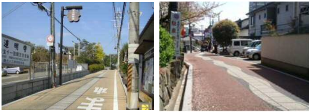
整備済みの東高野街道、商店街参道

すでに整備が済んでいる、東高野街道、商店街の参道に合わせて、宮前道路（東西・南北）、駅前の道路の整備を予定しています。