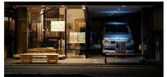
(事例紹介) 置きベン