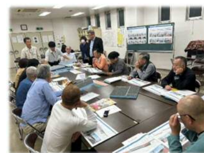
開催された会議の様子