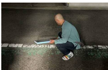
アスファルトと比べながら、すべすべ感を確認