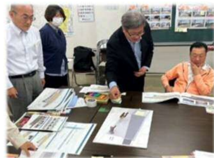
模型を囲みながらの話し合い