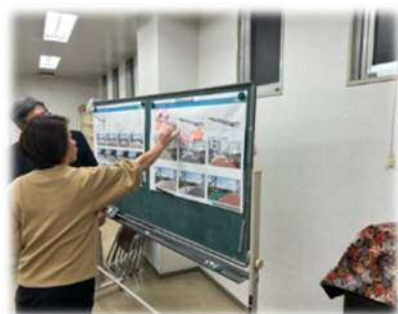
デザイン案をみんなで協議、検討