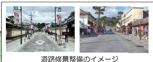
道路修景整備のイメージ