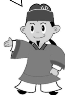
藤井寺市公式キャラクター「まなりくん」