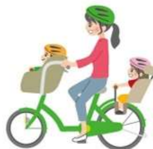
幼児二人同乗用自転車