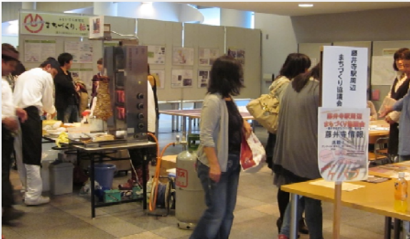
協議会のブースの様子

活性化イベント部会では、次年度に向けて、『駅周辺マップづくり』と『街なかバル（飲食店の梯子めぐりのイベント）』の実施に向けて、検討していきます。ご興味のある方、ご参加ください！