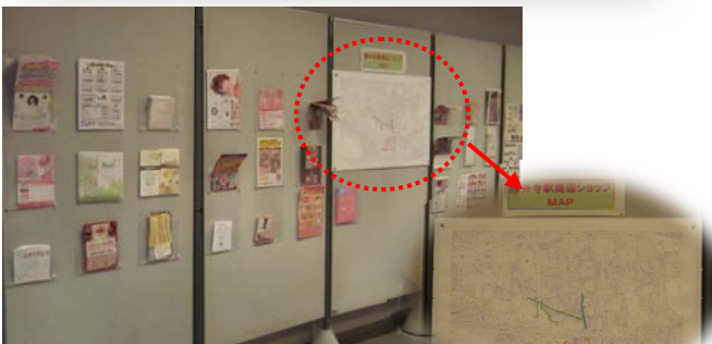
お店のチラシ展示コーナー