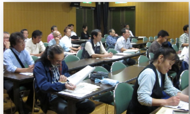
熱心に聞き入る出席者