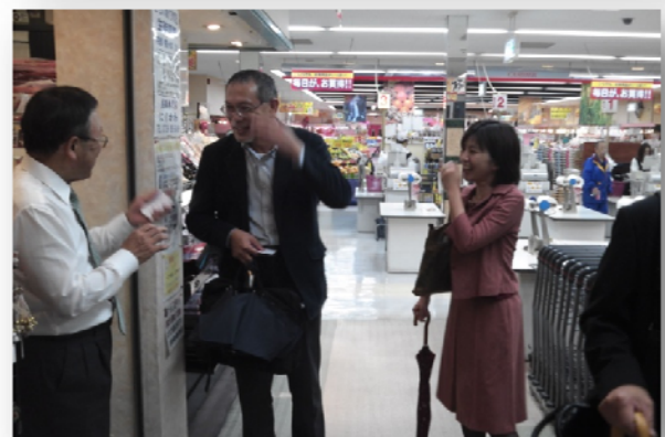
視察の様子(ビス河南にて)