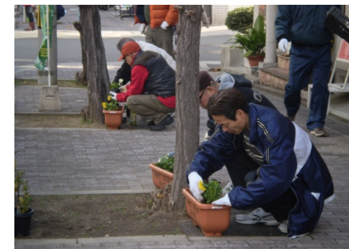
イチョウ通りにパンジーを植えました

また、部会だけでなくイチョウ通りの清掃、花植活動を開始しています。寒空の中、慣れた手つきで(?)パンジーの花を植えて、通りに彩を加えました。