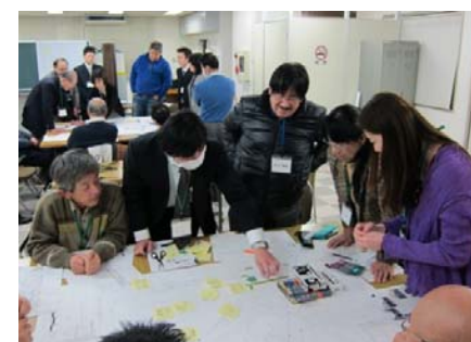
街並み整備部会のようす

興味のある方は恥ずかしがらずに会議に顔を出してください。また、Facebook「藤井寺街づくり協議会ファンクラブ」(35名登録)も御覧ください。みんなで藤井寺を盛り上げて行きましょう! よろしくお祈りします。