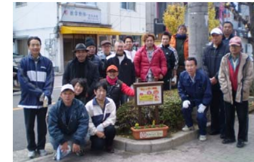
いちよう通りで記念撮影