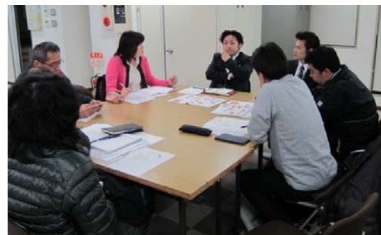
熱心に企画を練るマップづくりグループ

既に第1号の発行に向けて、マップのデザイン、紹介する店舗などの取材を開始しています。掲載に協力いただいた店舗から「期待しているよ！」とエールもいただいています。第2号はハロウィンイベントと連携した内容で特集を組んで発行する予定です。ご期待ください！