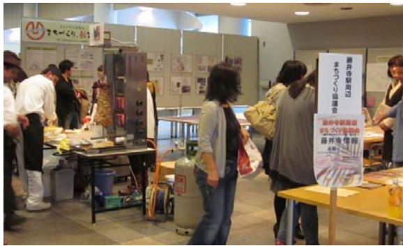
協議会 PR ブース（四天王寺大学学園祭）

平成23年度の活性化イベント部会は、計7回の部会を開催し、市民まつりと四天王寺大学学園祭に協議会のPRブースを出展しました。当初は、部会メンバーが十数名と少し寂しい状況でしたが、回を重ねるごとに、参加人数も増えて盛り上がってきています。概ね月1回開催している部会だけでなく、「伊丹まちなかバル」の視察、飲み会などが頻繁に開催され、会員同士の交流が盛んなことが本部会の特徴です。