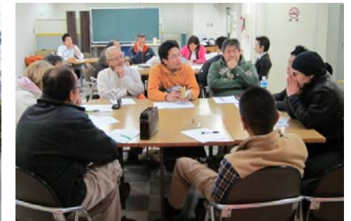
活性化イベント部会のようす