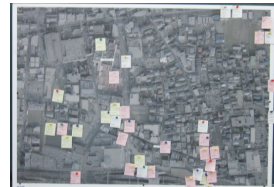
駅周辺の居場所マップ

また、部会だけでなくイチョウ通りの清掃、花植活動を開始しています。寒空の中、慣れた手つきで(?)パンジーの花を植えて、通りに彩を加えました。