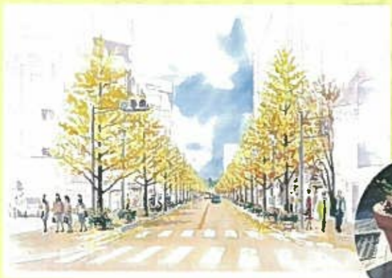
いちょう通り将来イメージ

いちょう通りを街のシンボルとして育てるために昨年より清掃活動などを始めました。今年度は市役所のご努力で、黒田緑化基金の助成を受けて、弱ったイチョウの植え替えとフラワーコンテナが設置されます。新年明けて早々、イチョウの植え替えが行われました。