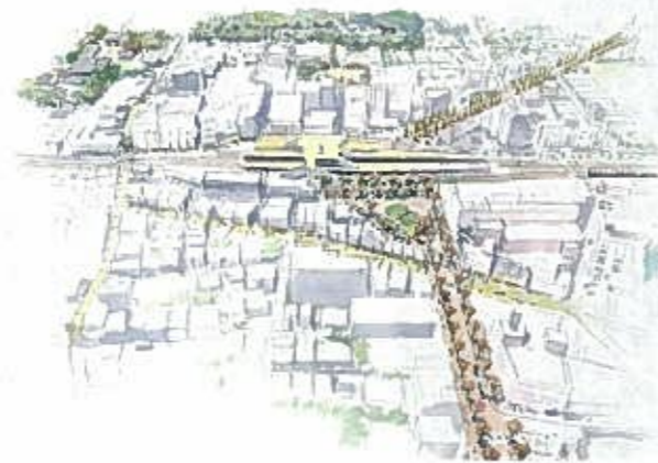
駅周辺の将来イメージ