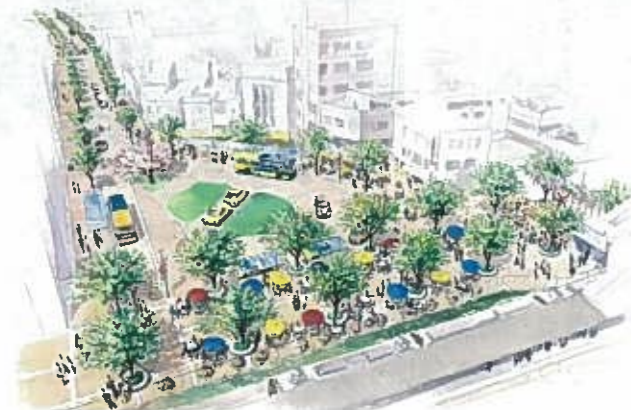
駅前広場・駅北線再整備のイメージ