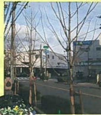
イチョウの植替と設置されたフラワーコンテナ