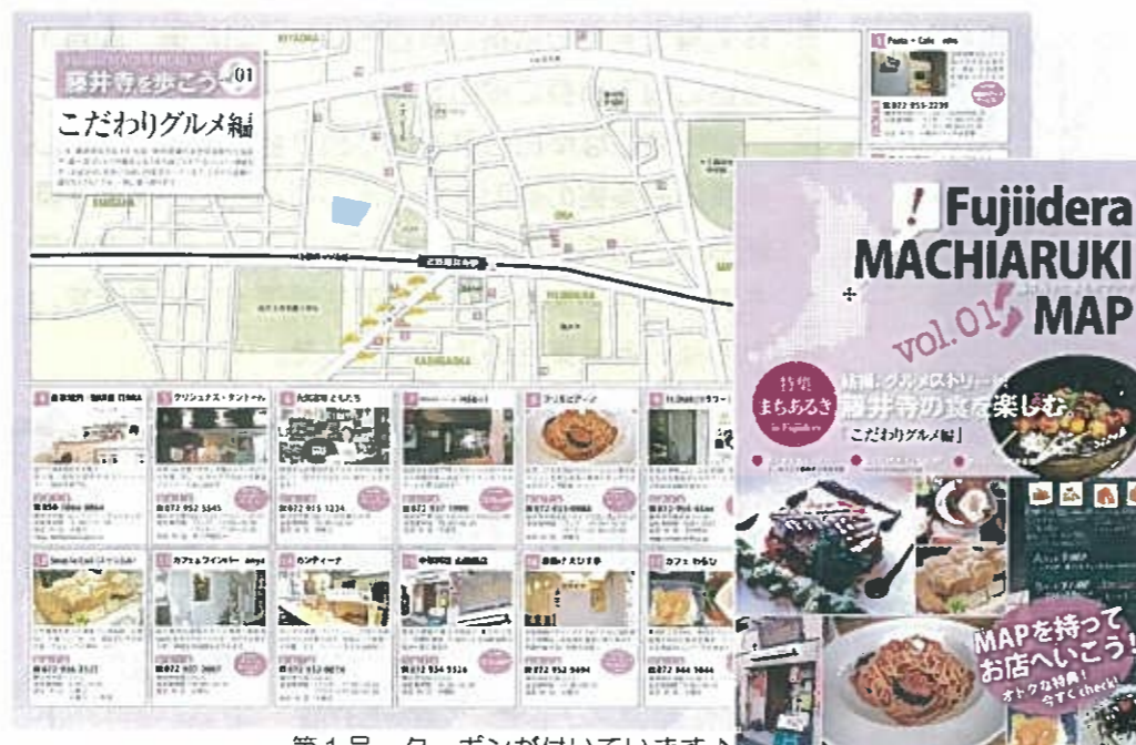
第1号 クーボンが付いています♪