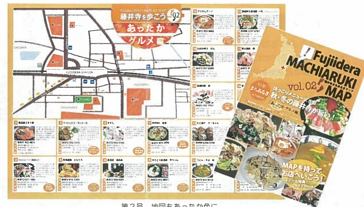
第2号 地図もあったか色に