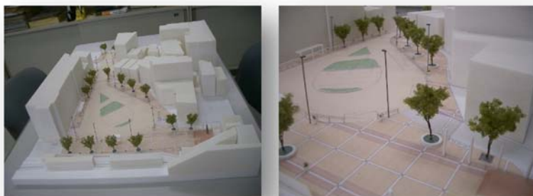
街並み整備部会で製作した駅前広場模型