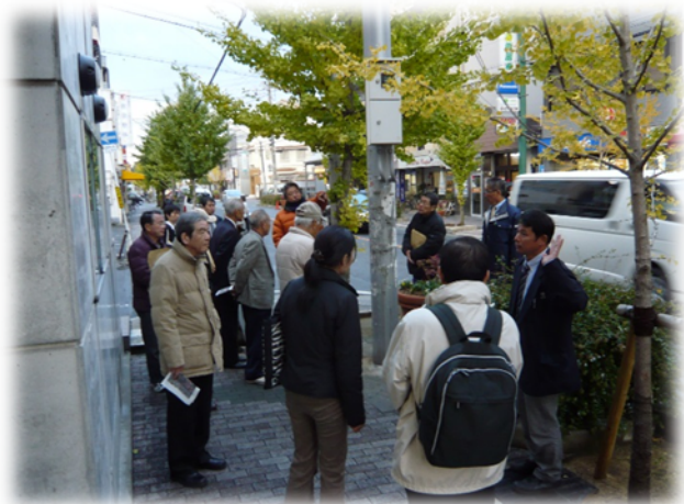
現地視察のようす

パスを片手に説明していく中で、当協議会としても近い将来目標を改めて認識いたしました。