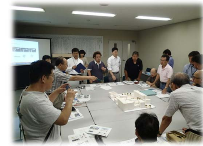
部会のような様子

また皆さんにもお声掛けさせていただきますのでイチョウ通りの活動にもご参加とご協力、よろしくお願いいたします！