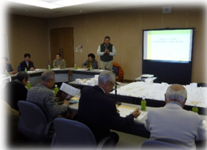
意見交換会のようす

それぞれの協議会から、まちづくり活動を行っていくうえでの運営資金や取り組みを進めていくうえでの問題点や課題、また直近の目標などについて、忌憚のない意見交換が行われました。