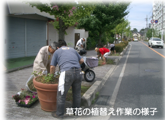
草花の植替え作業の様子

市では、さざんか通りの無電柱化事業、駅前広場整備については平成27年度末の竣工をめざし、取り組みが進められております。