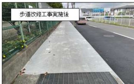
歩道改修工事実施後